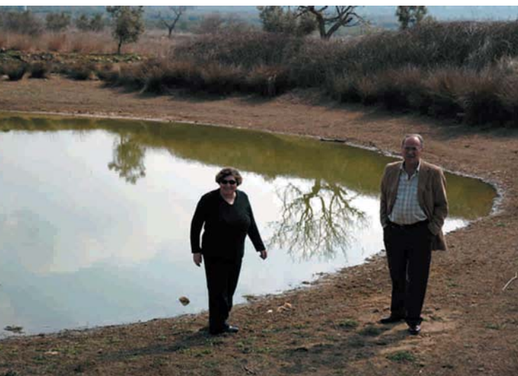
Instantánea de la visita a la Bassa Llecuna

bimilenarios. Es siempre una vista sobrecogedora: la vida, frágil y aleatoria, sobreponiéndose al tiempo con la alegría anual de ofrecer sus deliciosos frutos: esas aceitunas fargas, pequeñas, incomparables por su aceite y misteriosas por su procedencia de unos troncos casi minerales, retorcidos y torturados como espíritus de farmacéuticos. Si el tiempo modela a los olivos, a nosotros nos modelan los decretos. Y nos preguntamos: ¿Sobrevivirán? ¿Producirán fruto el año que viene? (Nos referimos, claro, a los olivos).