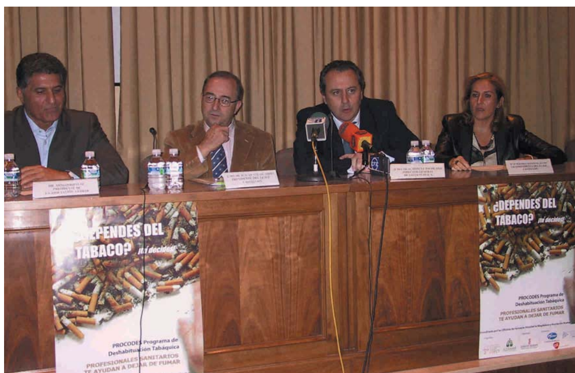
Presentación del programa PROCODES en el salón de actos del Colegio de Farmacéuticos el pasado mes de noviembre

Continuando con el protocolo se le pregunta al paciente sobre enfermedades que padezca en este momento o haya padecido, así como medicamentos que esté tomando actualmente. (Es conveniente que en caso afirmativo traigan el próximo día la bolsa con los medicamentos).