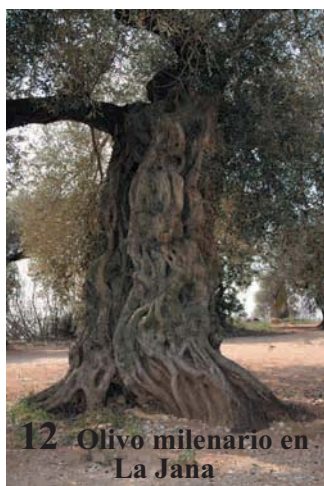
12 Olivo milenario en La Jana