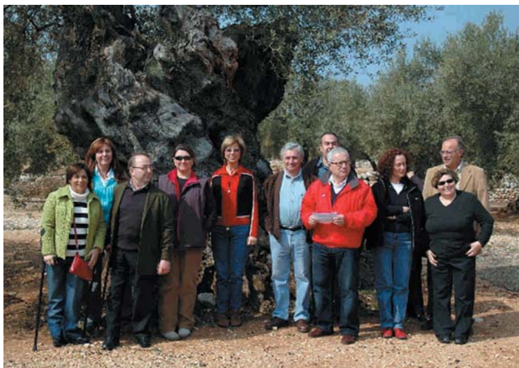
Componentes del grupo que hizo la visita turística y gastronómica a La Jana

Vimos y admiramos allí cerca algunos olivos