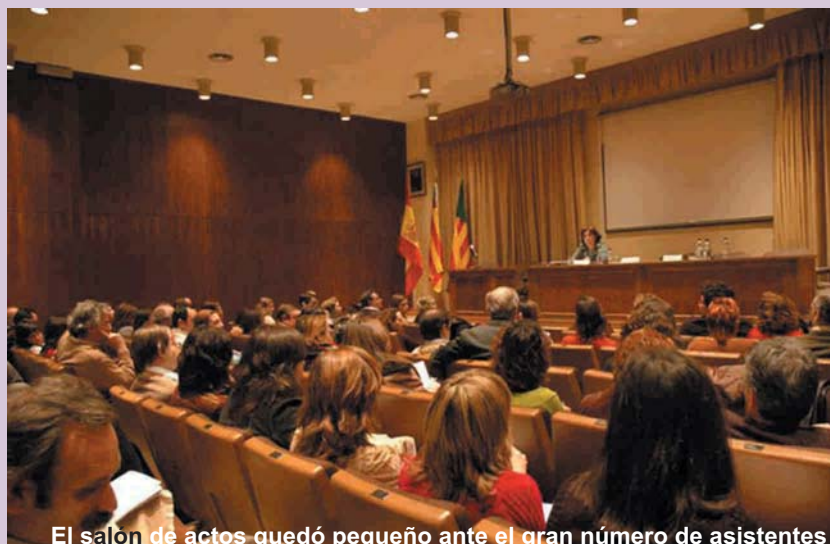
El salón de actos quedó pequeño ante el gran número de asistentes

Pero la gripe tiene gran tendencia a cambiar y a sorprender