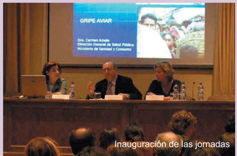
Inauguración de las jornadas

La vacuna proporciona protección parcial en niños africanos de 1 a 4 años, habitantes de áreas rurales endémicas, frente a las manifestaciones clínicas de la malaria por P. Falciparum como mínimo durante 18 meses.