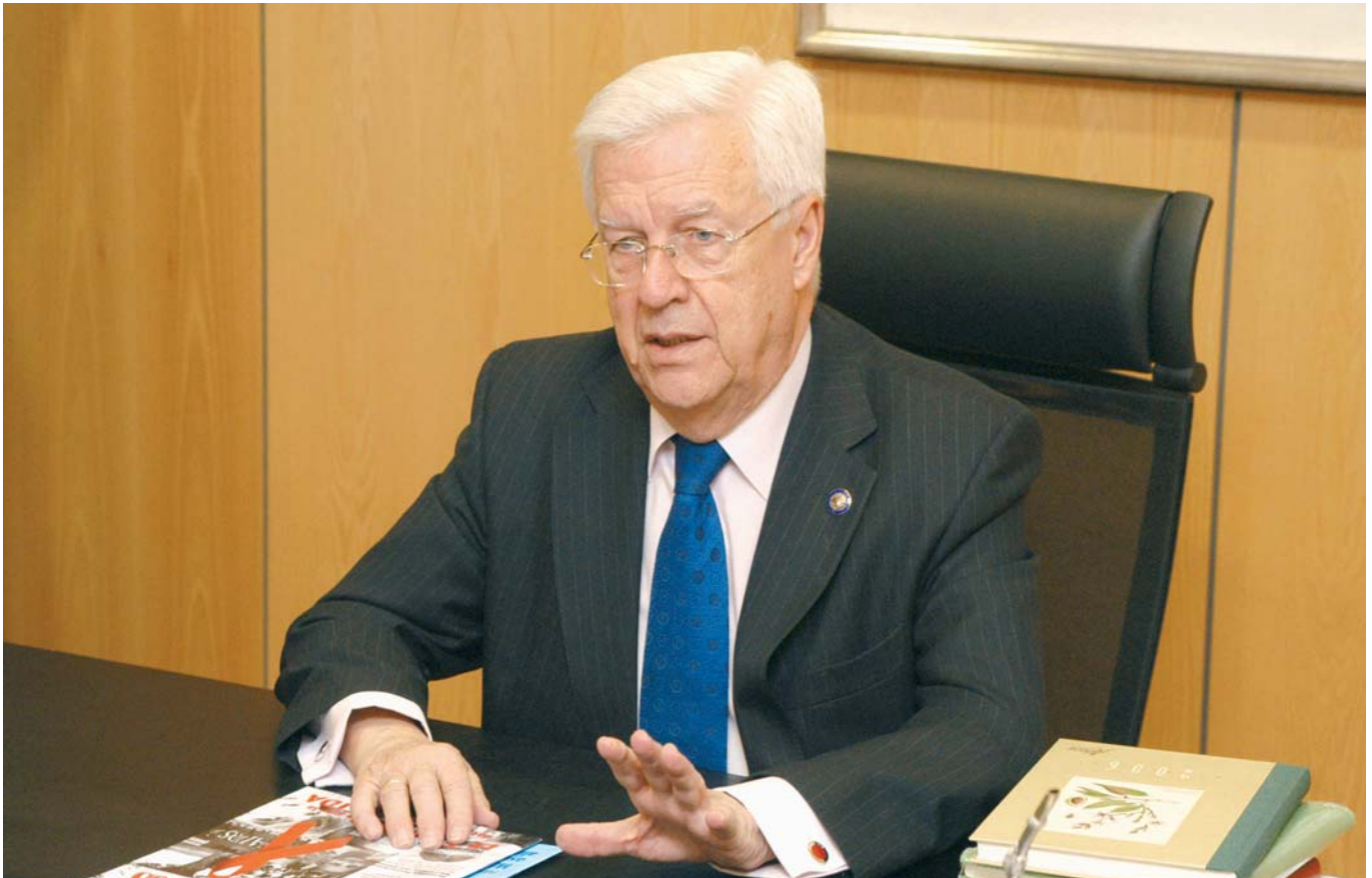
Pedro Capilla. Presidente del Consejo General de Farmacéuticos

Colegial ha seguido evolucionando y adaptándose a las nuevas necesidades profesionales, por ejemplo, mediante la creación de los Consejos Autonómicos. Siendo además, la primera organización colegial en incorporar la realidad autonómica en sus órganos de gobierno.