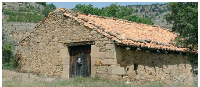
Aduana de Teruel