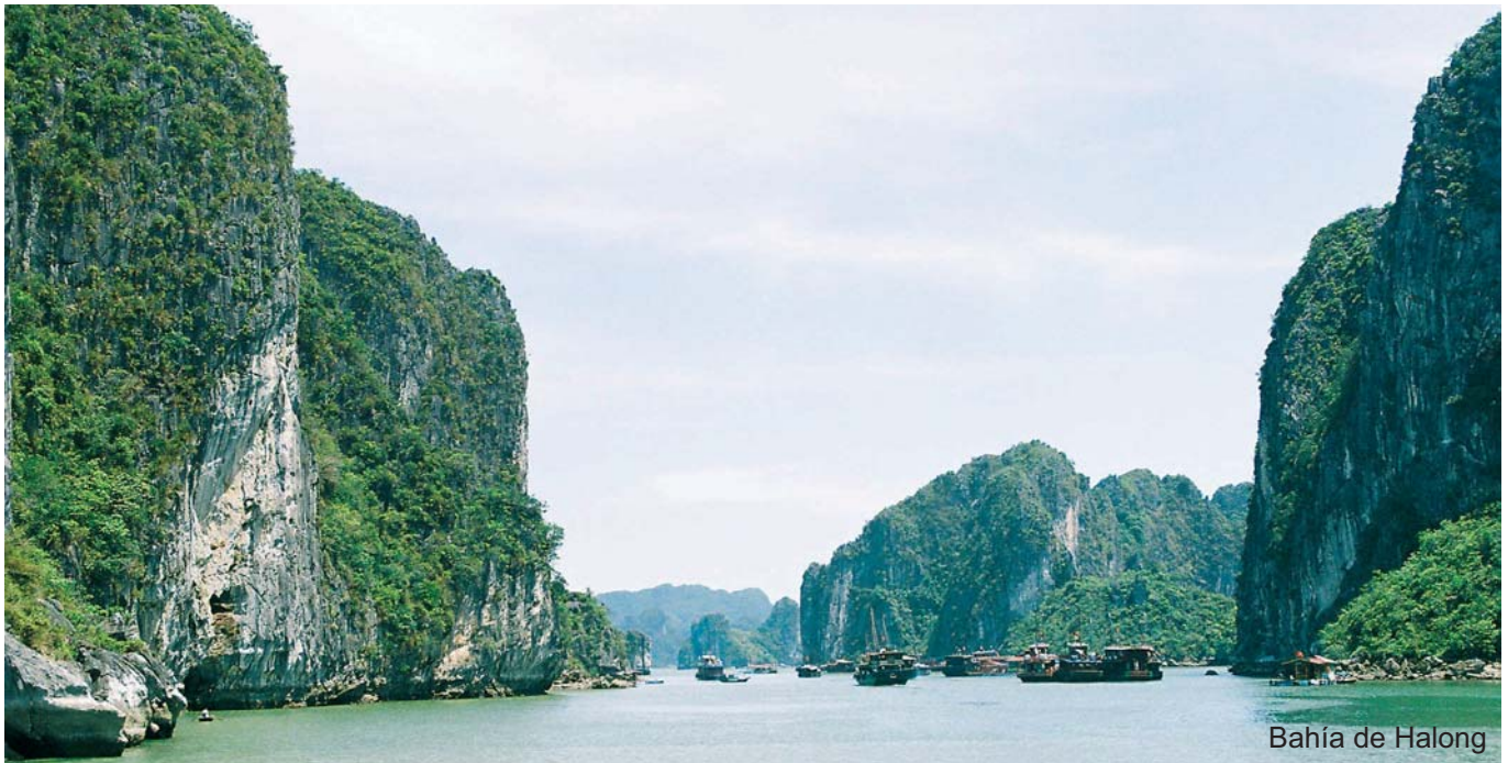
Bahía de Halong

La pasada primavera, se realizó el congreso anual de HEFAME, al que acudió un grupo de farmacéuticos de Castellón.