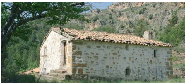
Aduana de Castellón

En los accesos al puente, tanto en la provincia de Castellón como en la de Teruel, podemos contemplar las casas de aduanas o fieltos. Eran dependencias administrativas donde se pagaban las tasas correspondientes al paso de bienes y mercaderías entre el Reino de Valencia y el Reino de Aragón. Ambos edificios se encuentran en un más que aceptable estado de conservación, sirviendo de refugio temporal en caso de inclemencias climatológicas.