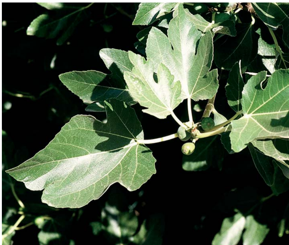
Hojas de higuera con el limbo palmeado.