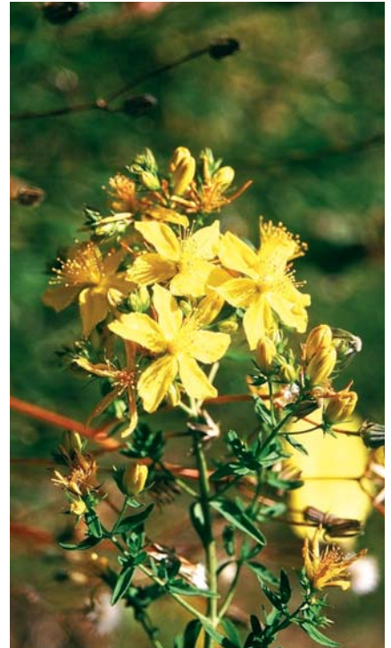
El Hipérico ( Hypericum perforatum L.) causa en los animales una fotosensibilización conocida como hipericismo.

Sus hojas, ramas y piel de los frutos contiene un látex con enzimas proteolíticos (fici-