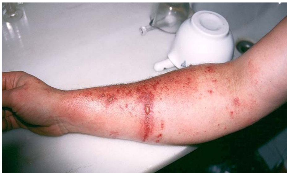
Fitofotodermatitis (acción fotosensibilizante por las furanocumarinas) y dermatosis por contacto (por la ficina), causadas por el serrín del Ficus carica .