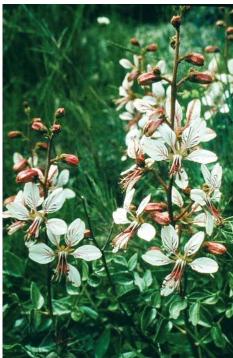
El Gitam ( Dictamnus hispanicus Webb ex Willk.) también provoca fotosensibilidad.

na) y furanocumarinas (metoxi-5 psoraleno o bergapteno y el 8-metoxipsoraleno o amoidina), responsables de su actividad fotosensibilizante (fitofotodermatitis causada por el contacto de la piel húmeda con estas sustancias en presencia de radiaciones ultravioletas), provocando erupciones fototóxicas con vesículas e hiperpigmentaciones persistentes, típicas sobre todo en verano al escalar las higueras o intentar cortar sus ramas. Estas lesiones son similares a quemaduras (ver foto). El látex es muy tóxico e irritante de las mucosas, provocando por vía interna una acción