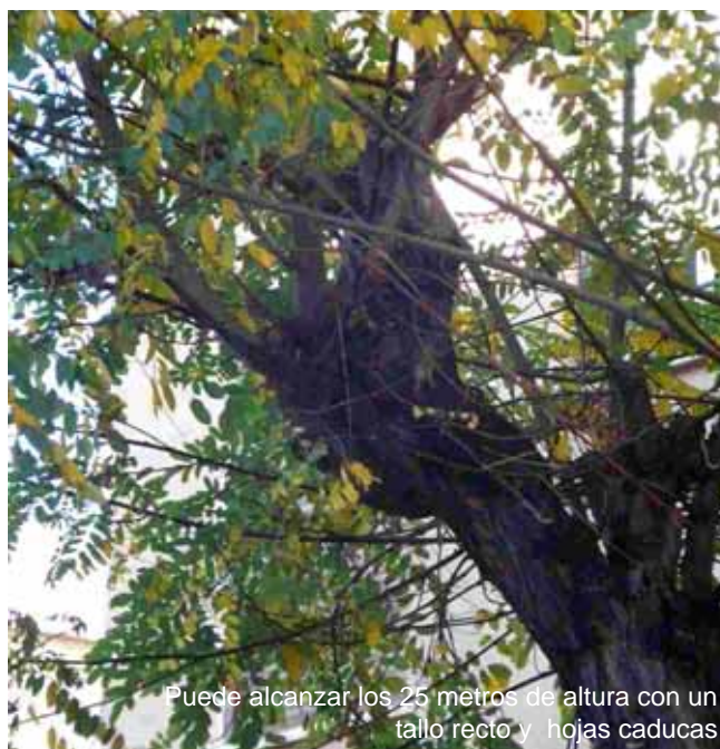
Puede alcanzar los 25 metros de altura con un tallo recto y hojas caducas

plaza del Delfinado en París. 35 años después, el árbol nacido de esta semilla fue trasplantado al Jardín Botánico de la capital francesa, donde aún se puede admirar esta robinia histórica que ha desafiado los siglos. De Francia se incorporaría a Barcelona y más tarde a Madrid, de