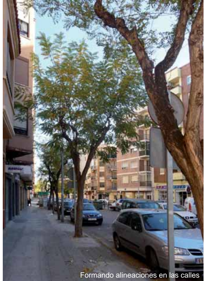
Formando alineaciones en las calles

La madera del árbol es muy pesada, dura y resistente a la podredumbre; se trabaja con algo de dificultad siendo desde la antigüedad empleada para elaborar aperos de