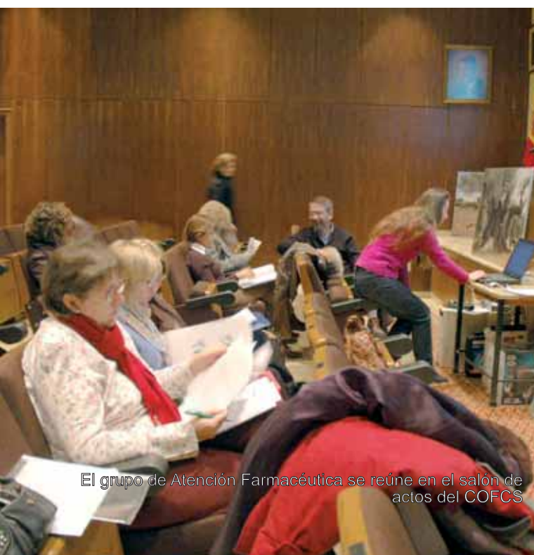
El grupo de Atención Farmacéutica se reúne en el salón de actos del COFCS