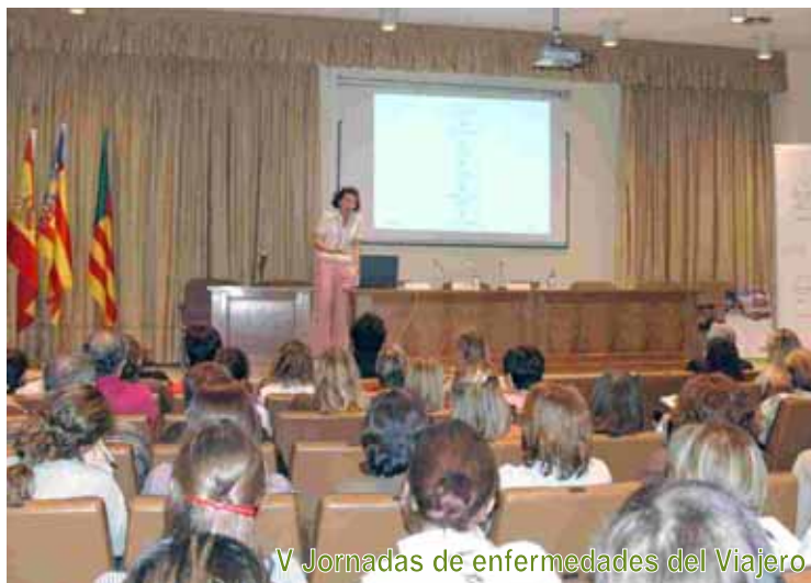
V Jornadas de enfermedades del Viajero