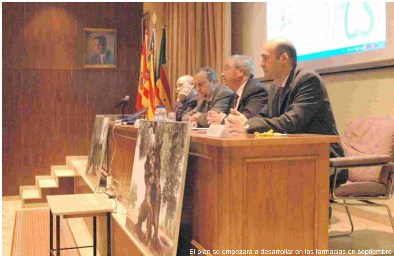
El plan se empezará a desarrollar en las farmacias en septiembre

también los años de vida perdidos por enfermedades cardiovasculares, y mejorar la calidad de vida de aquellas personas que hayan sufrido un accidente cardiovascular. Por último se tratará de mejorar el conocimiento de los factores implicados en el desarrollo de las enfermedades cardiovasculares y su abordaje. Otro de los objetivos será, incrementar los hábitos de vida saludables y a su vez reducir la prevalencia de los factores de riesgo cardiovascular. También se tratará de incrementar el porcentaje de sujetos diagnosticados de padecer uno o varios factores de riesgo, así como incrementar el porcentaje de control adecuado de los factores de riesgo cardiovascular tanto en prevención primaria como en secundaria.