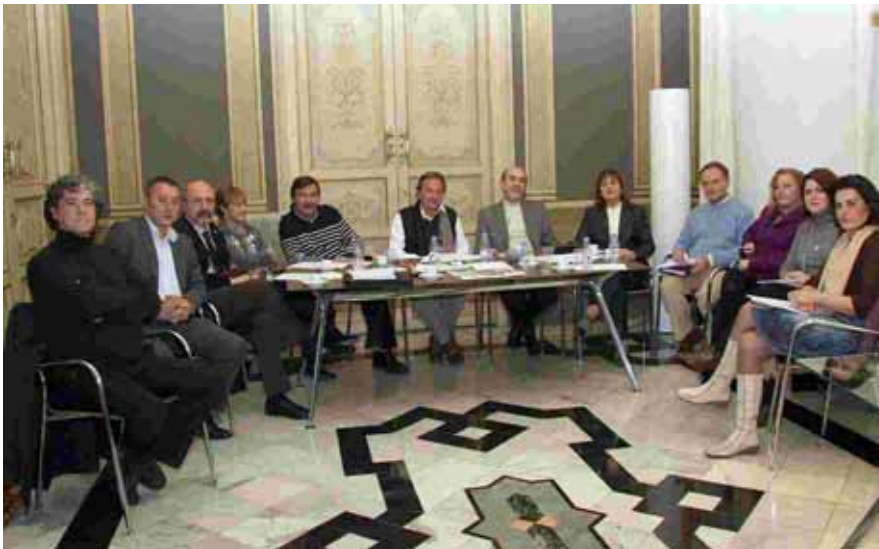
Reunión celebrada el pasado mes de marzo en Valencia

Esto está llevando a una innecesaria guerra de precios