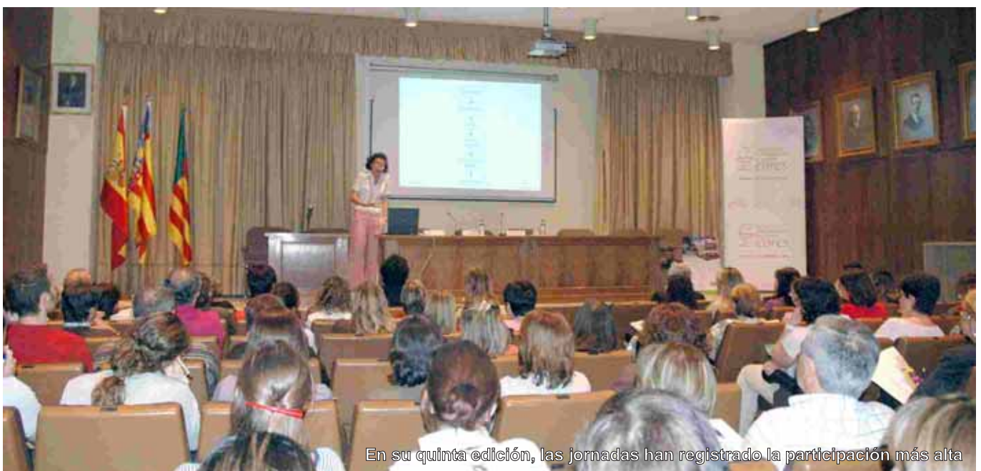
En su quinta edición, las jornadas han registrado la participación más alta