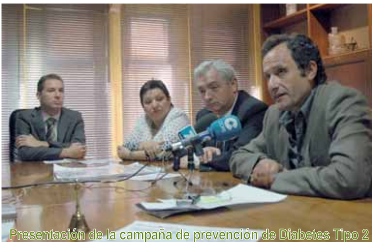
Presentación de la campaña de prevención de Diabetes Tipo 2