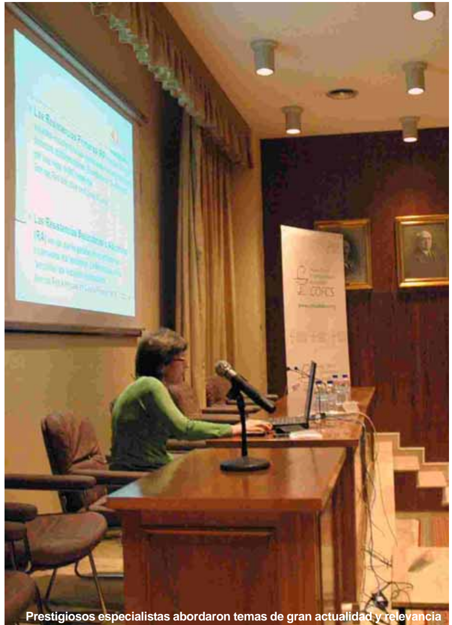
Prestigiosos especialistas abordaron temas de gran actualidad y relevancia