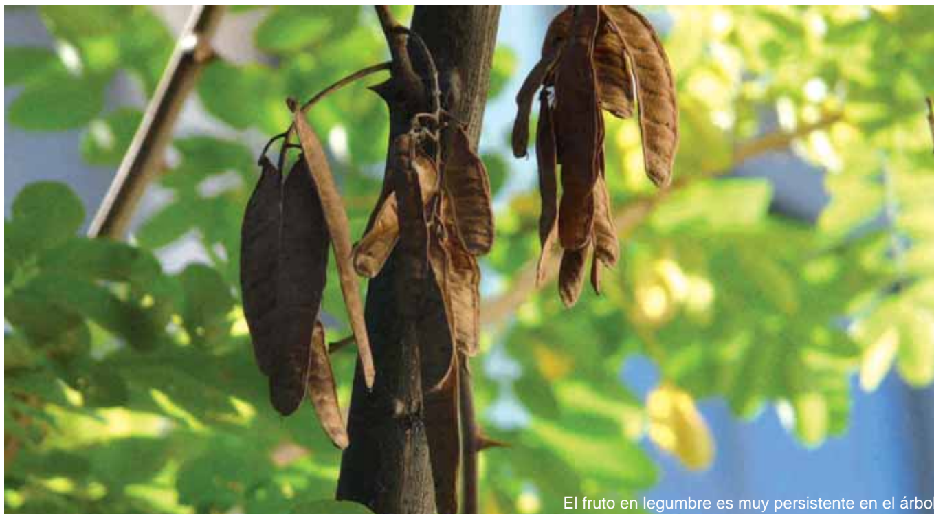
El fruto en legumbre es muy persistente en el árbol

Un árbol que nos acompaña con frecuencia en las ciudades y pueblos de la provincia de Castellón es la robinia o falsa acacia ( Robinia pseudoacacia L.). Es un árbol muy frecuente como ornamental en parques, jardines, calles, incluso en carreteras, bordes de caminos y entradas a las poblaciones del interior castellonense. Es típico en las estaciones de trenes verlos fijando los taludes (gracias a sus raíces gruesas con ramificaciones largas y rastreras que pueden a larga distancia presentar retoños). Pertenece a la familia botánica de las Leguminosas y recibe nombres populares como robinia, acacia común, acacia blanca, acacia de flor blanca, acacia bastarda y falsa acacia. Ya el nombre de la especie (pseudoacacia) hace referencia al parecido de algunas acacias con la robinia. El nombre del género “Robinia” fue en honor de Jean Robin, jardinero, profesor y botánico de María de Médicis y Enrique IV, ya que fue junto a su hijo los primeros en plantar el árbol en Europa en el Jardín des Plantes de París y creyeron que se trataba de una acacia. Este jardinero del rey de Francia era el encargado de cuidar las plantas medicinales (conocido como el “simplista”) y fue en 1601 cuando recibe una semilla procedente de América del Norte que es sembrada en la