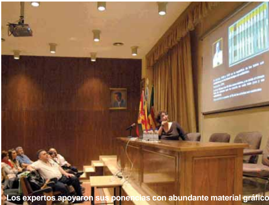
Los expertos apoyaron sus ponencias con abundante material gráfico

El siguiente día, el viernes 8, se llevó a cabo un monográfico sobre “Actualización en tuberculosis”, una enfermedad que debido a diversos factores epidemiológicos y sociales ha experimentado en los últimos años un incremento significativo. De ahí la importancia de los tratamientos directamente observados (TOD), donde las farmacias han realizado experiencias con resultados muy satisfactorios al entregar y tomarse el enfermo su tratamiento en presencia del farmacéutico, sin tener que desplazarse a los centros hospitalarios, en cuyo caso, el abandono del tratamiento es mayor. Cabe recordar que el Colegio Oficial de Farmacéuticos de Castellón firmó hace unos años un acuerdo con Conselleria en este campo.