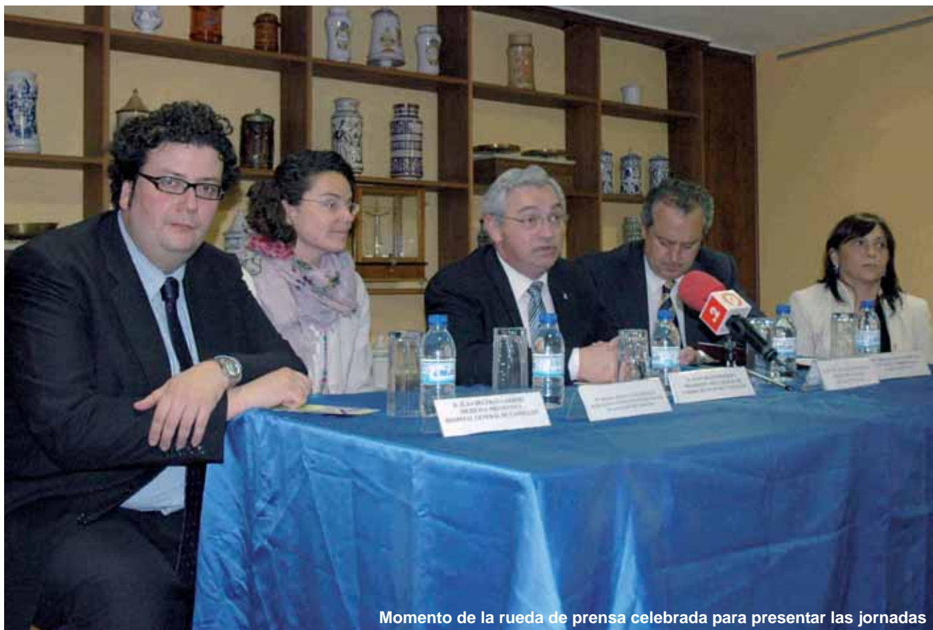
Momento de la rueda de prensa celebrada para presentar las jornadas

Los pasados días 7 y 8 de mayo tuvieron lugar en nuestro Colegio Oficial de Farmacéuticos las V jornadas del viajero. Un evento que, en su quinta edición, ha conseguido reunir a más de 120 profesionales sanitarios entre farmacéuticos/as, médicos/as y enfermeros/as.