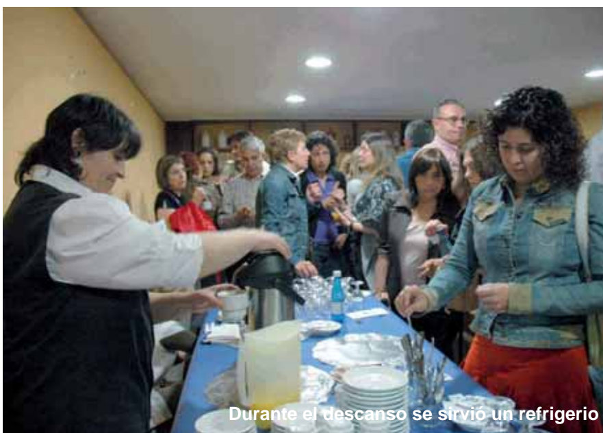
Durante el descanso se sirvió un refrigerio