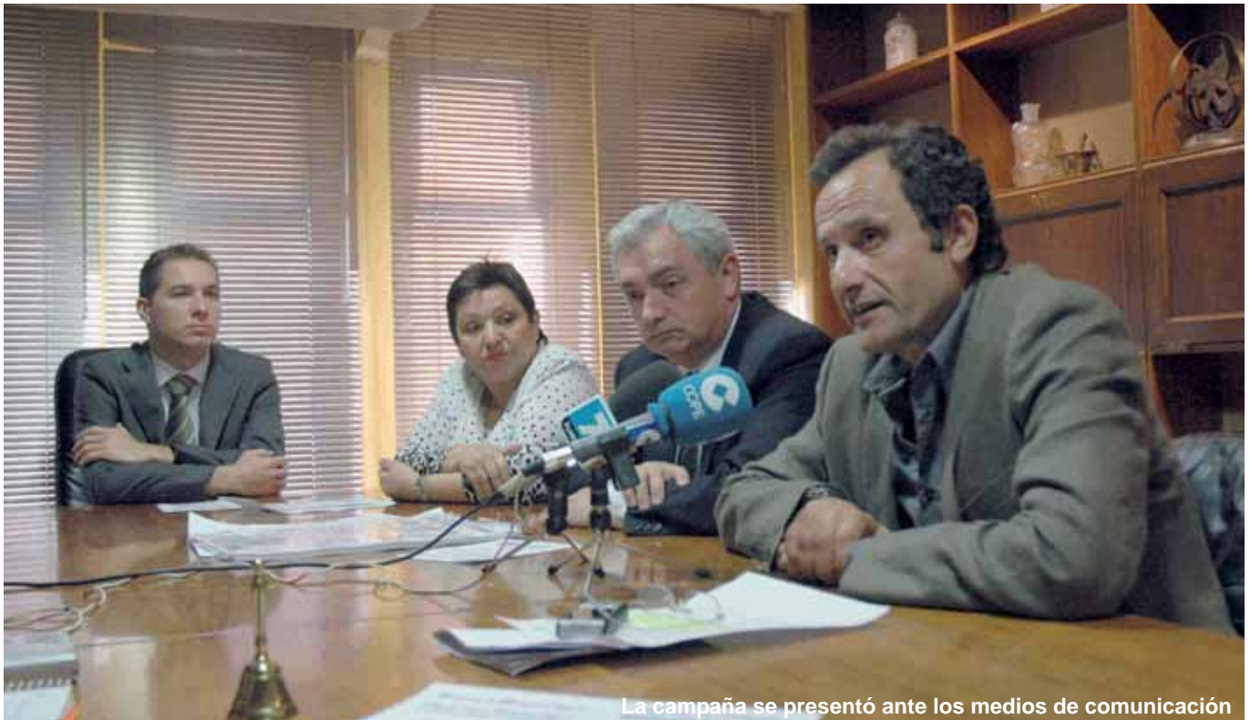
La campaña se presentó ante los medios de comunicación

A partir del próximo mes de mayo, y hasta finales de junio, los usuarios de las oficinas de farmacia de la provincia de Castellón podrán hacerse análisis de manera totalmente gratuita, para detectar y prevenir la aparición de diabetes tipo 2.