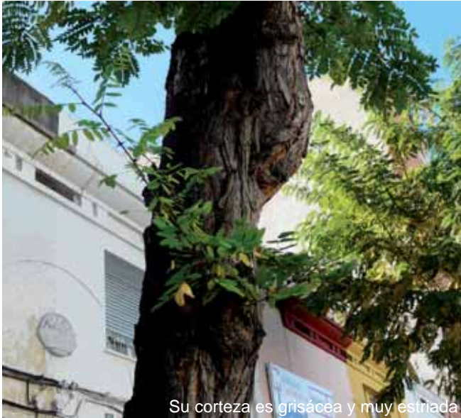
Su corteza es grisácea y muy estriada

donde proceden los ejemplares que se encuentra en el Retiro y en Aranjuez.