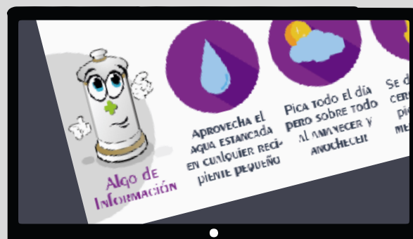
Comentarios en Campañas Corporativas