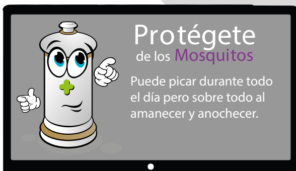
Consejos en las Redes Sociales