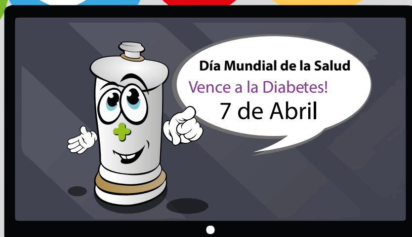
Notificación de Eventos relacionados con la Farmacia